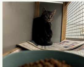
Kattene indfanges forsigtigt, vurderes af katteinspektøren og bringes til internatet...