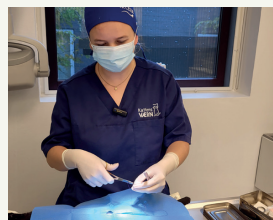
Kattene sygdomstestes, neutraliseres og øre- og chipmærkes...