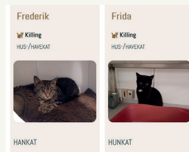
Og nu er to dejlige og sunde katte klar til at blive adopteret og finde et kærligt hjem...