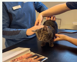
Kattene socialiseres, sundhedstjekkes, får ormekur og vaccineres...